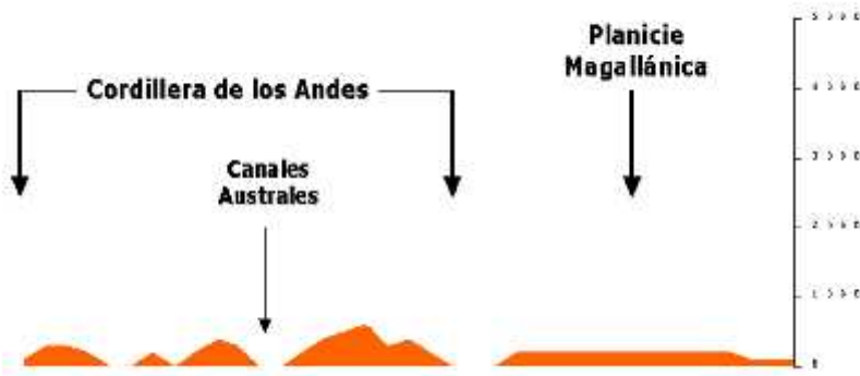
Perfil Topográfico 54° Latitud Sur

Está marcada por la presencia de una cordillera de los Andes que se desmembra en ciento de islas separadas por canales. Es una Zona lejana y fría, ya que tiene un clima templado frío lluvioso, reino del viento y de la soledad, la naturaleza domina con su magnificencia y belleza y se presenta difícil para la vida de la escasa población que la habita. Los ríos son cortos y caudalosos como el Baker.